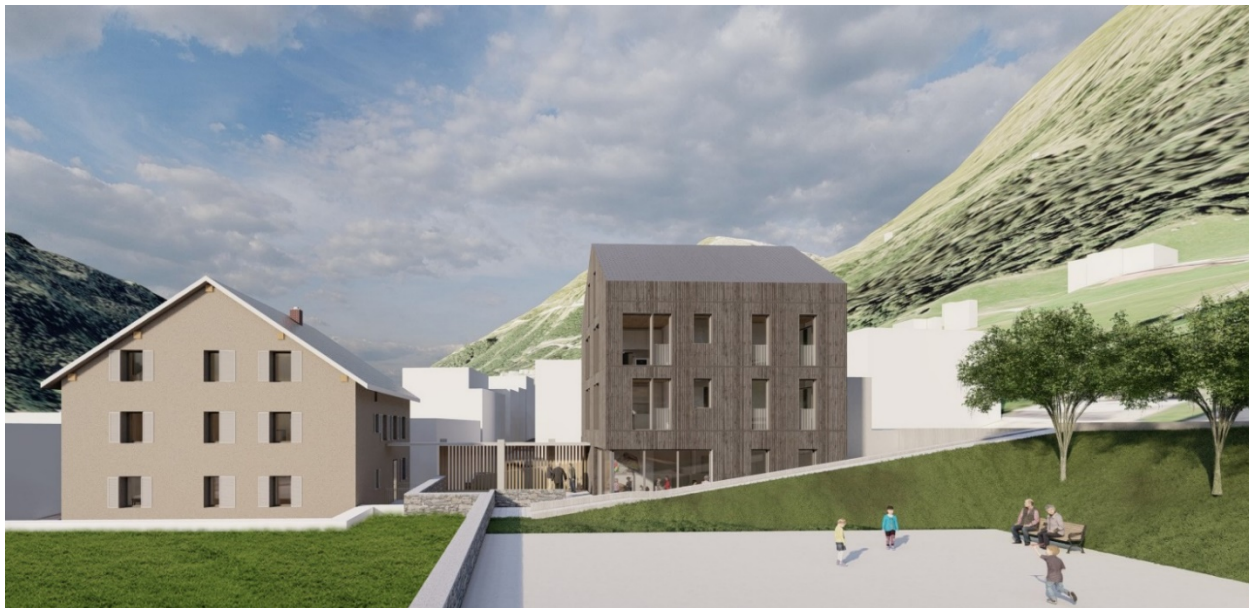
Casa San Gottardo

Documenti da presentare: curriculum vitae, referenze, diplomi e certificati conseguiti, autocertificazione di buona salute (scaricabile dal link www.comuneairolo.ch/formulari ), casellario giudiziale ed estratto delle esecuzioni.