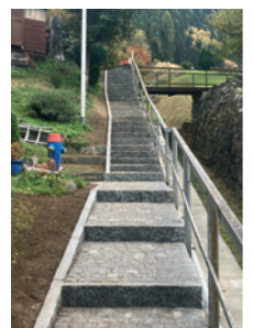
Scalinata Alpina prima e dopo i lavori.