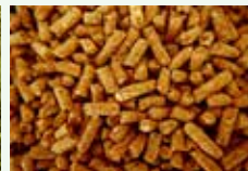
Lettiere vegetali di piccoli animali non carnivori