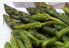
Scarti organici di cucina vegetali cotti