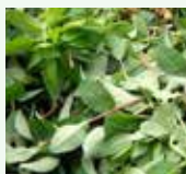
Scarti vegetali del giardinaggio: erba, rametti, foglie, fiori, rami