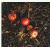
Residui non decomposti del precedente processo di compostaggio